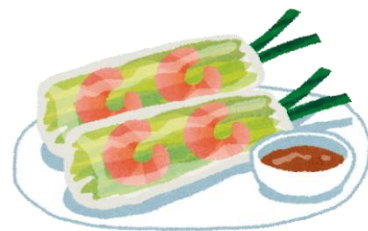
なまはるまき 生春巻