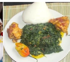
フフコーンとンジャマンジャマ