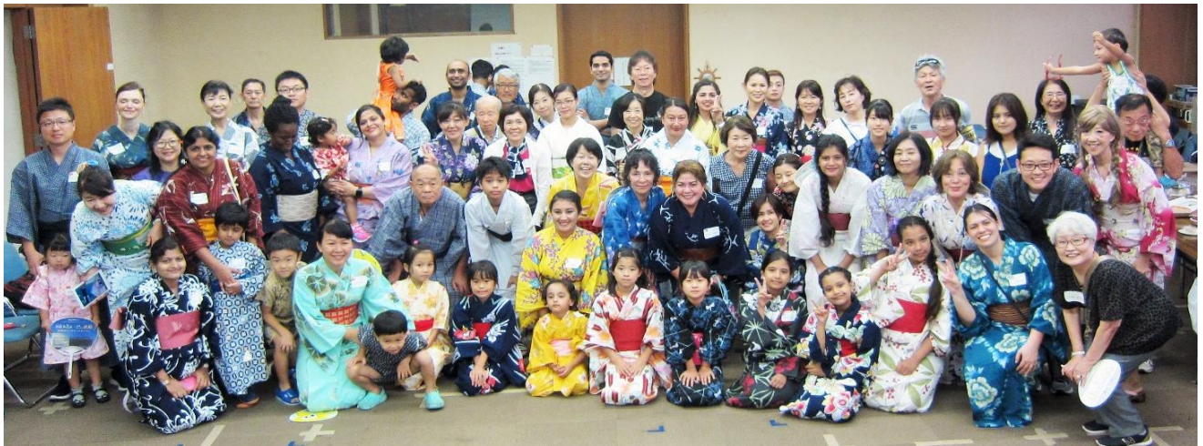
盆踊りで、学習者と日本語ボランティア、そして市民と一緒に国際交流♪