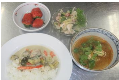
ほんかくてき りょうり 本格的な料理ができました