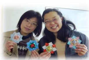
じょうずにお上手に折れました