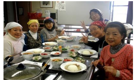
やっとなんせい やっと完成！いただきます