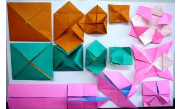
じゅんぱんなら 順番に並べられたパーツ