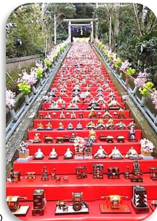
勝浦のビッグひな祭り

市内各所に約2万5千体ものひな人形が飾られる。遠見岬神社の60段の石段では、一面に敷かれた緋毛氈に1200体もの人形が飾られ、夕暮れ時からライトアップされる。また、勝浦中央商店街には各店舗が工夫をこらしたひな人形が展示される。期間中は、子どもたちが稚児の衣装で統一したひな行列、歩行者天国、各種出店など、盛りだくさんのイベントが行われます。