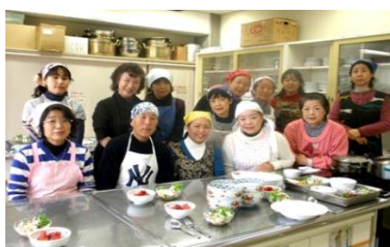
みんなできんさつえい みんなで記念撮影