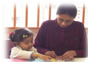
きょうみしんしん 興味津津です