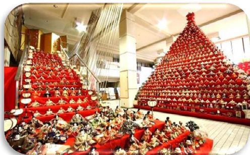
日本一高いピラミッドひな壇は圧巻!

鴻巣市における人形制作は約380年の歴史があり、鴻巣の貴重な伝統工芸として現在に伝えられている。鴻巣市役所ロビーに、吹き抜け天井すれすれの日本一高いピラミッドひな壇(31段 高さ7m)や、5角すい形ひな壇、8角すい形ひな壇などが飾られる。昨年よりもさらに高さが増し、見ごたえ十分です!