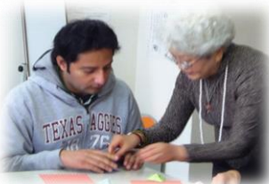
ちょっと難しいかな?

事務局のカウンターに作品と作り方を置いておきますので家でもたくさん作って遊んでみてくださいね。(佐)