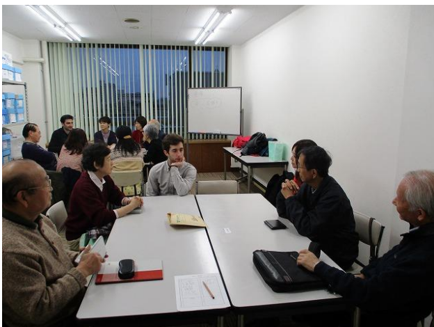
毎週、様々な人たちが集まります