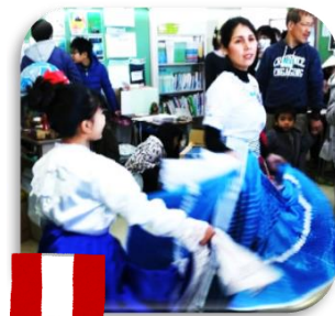
カチェスカさん(右)と姪御さん