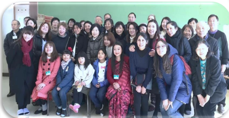
過去最多の学習者が参加してくれました！お疲れさまでした