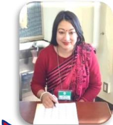
カリスマさん (ネパール)

このような活動は、世界の他の国々への理解を深めるのに役立つと思います。運営して下さったボランティアの方々、色々サポートして下さった皆様に感謝しています。