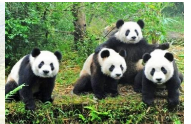
四川のジャイアントパンダ保護区

パンダが贈られて日本中がパンダブームになるずっと前の唐の時代(618年～907年)に、中国唯一の女帝 則天武后が天武天皇に中日友好大使として、2匹のパンダを贈ったと言われています。