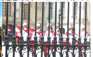
ペルー政府の衛兵交代

建てられ、街全体が世界遺産となっています。平日の正午に行われるペルー政府での衛兵の交代式は、観光スポットの一つです。リマ近郊にあるインカ帝国時代の神殿を中心