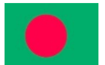
中央が赤、背景が緑

日本語の教育が熱心で、各大学には日本語コースもあり、民間の日本語学校は30校以上あります。