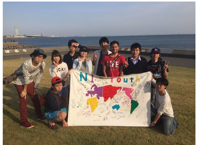
終了後、茜浜緑地で東京湾を背景に記念撮影。