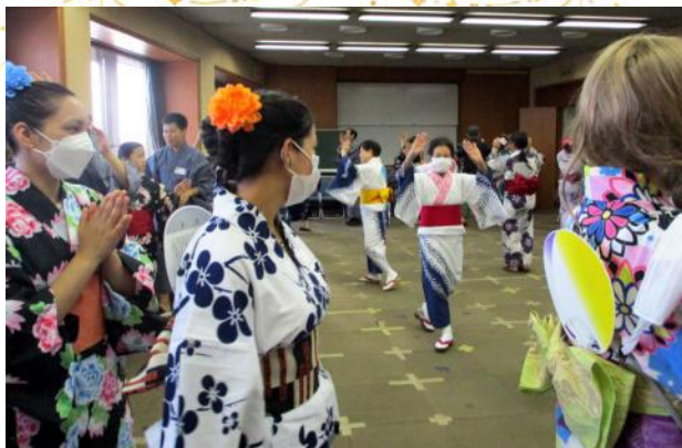
大会議室で本番前の練習

が、あちこちで尽きることなく見受けられました。ある学習者は出身国の両親に「日本で友だちと楽しんでいます」と写真を送ると言っていました。