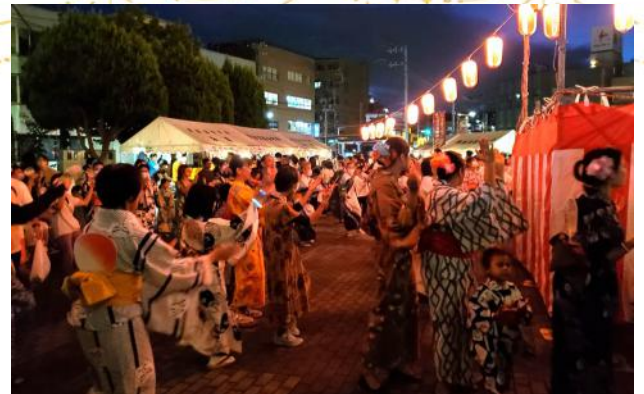
市民の中に交じって踊りました

浴衣の着付けは予約をすることになっていましたが、その場で「やっぱり浴衣を着たい」という希望者にも、予備とサイズが合う限りボランティアの着付け担当者が対応していました。はじめて浴衣を着た学習者は、大変うれしそうな様子で、家族や友人と写真を撮り合ったり、ボランティアに写真をお願いする姿