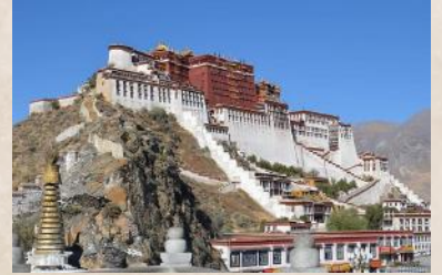
チベット・ポタラ宮殿。

つきました。私が立ち寄った土産物屋の主人が警察に呼ばれたことを数日後に知りました。一番驚いたのは、マイクロバスの運転手のことでした。5000メートルの峠を越えて、ある少数民族の村に行った時、途中の休憩で立ち寄る村落で最も歓迎されたのが、この運転手でした。なぜか？彼は欧米で教育を受けた地元出身の共産党の超エリート幹部でした。つまり運転しながら我々の会話（英語）をすべて聞いていたのです。