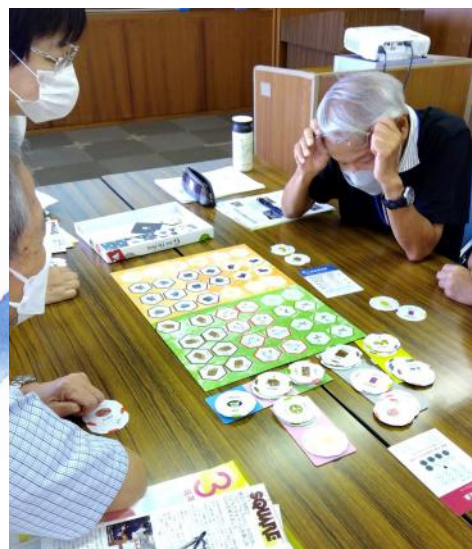
チームでゲームに取り組みます