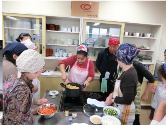
▲世界の料理教室 2019年2月 ◀バスハイク 2019年11月